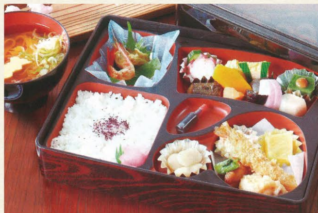
◆季節の弁当 1,650円 (きしめん付)