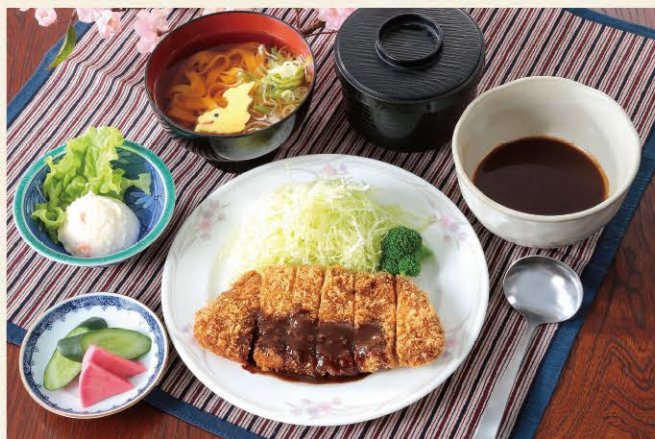
◆みそかつ御膳 1,650円 (きしめん付)