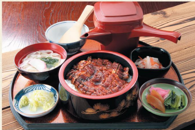
◆名古屋名物ひつまぶし御膳 2,750円 (きしめん・小鉢付)