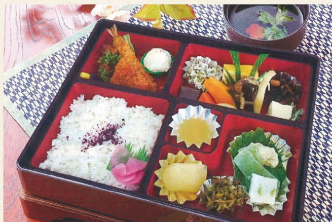
◆季節の弁当 1,320円 (汁付)