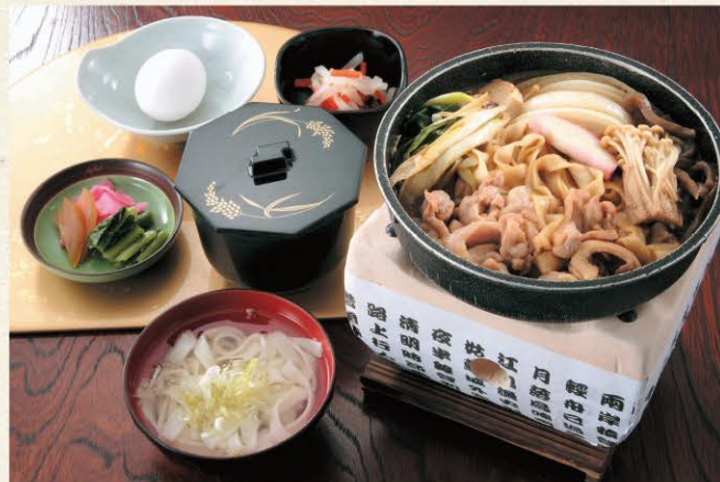
◆名古屋コーチンのすき焼き御膳 2,750円 (きしめん・小鉢付)